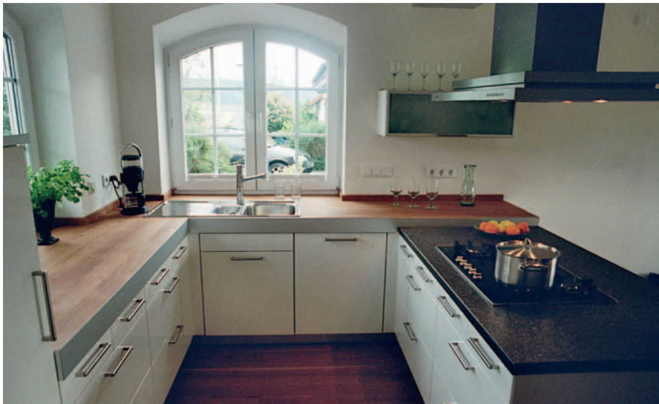
Wunderbare Wandlung: Aus alten Kirschbaumdielen schreinerte die Sindern Manufaktur eine zehn Zentimeter dicke Arbeitsplatte.

Nichts ist unmöglich – oder: Gebaut wird was gefällt