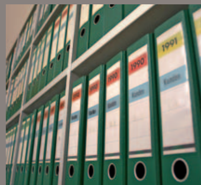
Firmengeschichte zum Anfassen: In über 300 Aktenordnern lagern „die Sindern-Küchen“ seit 1970.