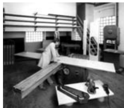
In den ehemaligen Klassenräumen richtete der Firmengründer dann die Werkstatt ein.

den Förderpreis Sicherheit aus der Hand von Professor Rita Süssmuth“, blickt der Seniorchef zurück. „Erfinden“, sagt der passionierte Schreinermeister und Tüftler, „Erfinden ist wie Musik schaffen – ich habe bis heute Spaß daran.“