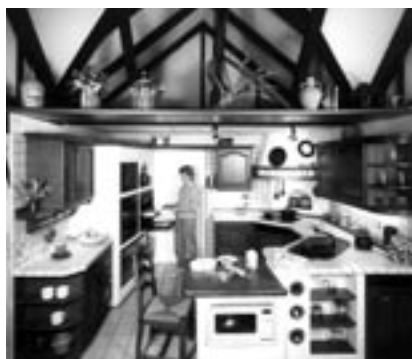
Unter dem Tennendach gab es bereits 1982 eine rustikale Aktivküche mit gefliester Arbeitsplatte.