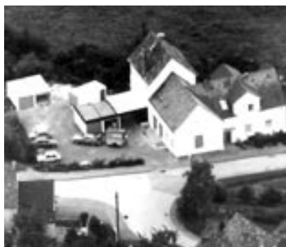
Die ehemalige Dorfschule von Niedereimer wurde 1971 zur „Küchentenne“.