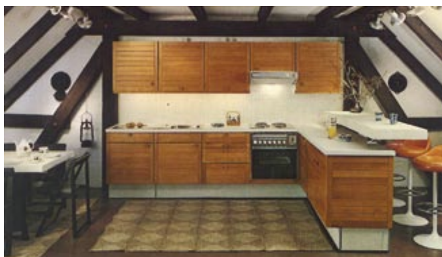
Eine der ersten Studioküchen ganz im Stil der 70-er Jahre.

Eine ganz stille Facette soll am Ende einer Würdigung eines interessanten Menschen stehen. Sein soziales Engagement, gekennzeichnet durch seine Unterstützung für Schwester Emanuelle aus Kairo, die sich um die Ärmsten der Armen kümmert, aber auch seine Liebe zu Israel sind Seiten seiner Persönlichkeit, die nicht so sehr an die Öffentlichkeit dringen, Franz-Heinrich Sindern aber trotzdem charakterisieren – eben als freundlichen, vielseitigen und begabten Menschen. ■